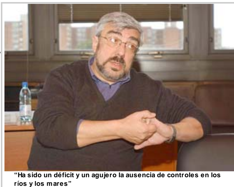
“Ha sido un déficit y un agujero la ausencia de controles en los ríos y los mares”

-¿De cuál de ellos? ¿Del chico? ¿Del grande? El traficante grande y mediano no lee los códigos penales. Hace un cálculo costo-beneficio de la transa. La mula, el chico, no repara en nada. Está jugado a todo. Tampoco lo disuade la ley porque lo que no existe es noción de ley. La ley para mucha gente es la ley de la selva, la supervivencia bajo cualquier código. Prefiero aumentar las penas contra aquellos que en buena posición se han dedicado más a la estafa y a los acomodados que a asegurar los controles y las fronteras en el ingreso de drogas. Ha sido un déficit y un agujero la ausencia de controles en los ríos y los mares. Eso es así. El logro fundamental de la lucha contra el narcotráfico es de la Policía. La misión específica de control de entrada al país, de jurisdicción específica en los pasos de frontera y todo el límite fluvial no se ha cumplido con cabalidad. Por eso es más coherente profundizar todas las herramientas que hasta ahora no se han realizado bien y ser muy duros con quienes están en incumplimiento sino estamos cojos y hemipléjicos. La responsabilidad sobre el auge del narcotráfico y el lavado de dinero no está sólo en los traficantes, sino en insospechables actores, que salen en galería de